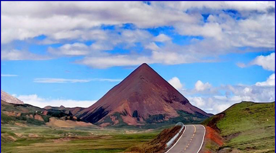
མཐོ་ཞིང་བརྗིད་པའི་ནགས་སྟོད་ཤར་གྱི་རི་བོ་རྒྱང་ལ།