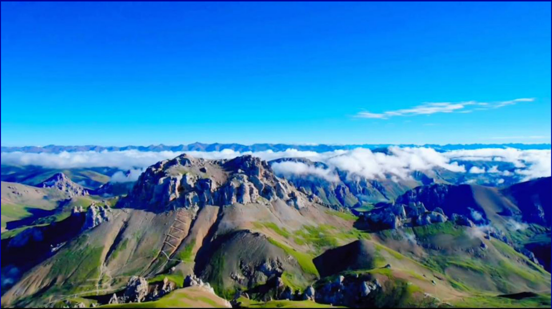
མཛེས་ཤིང་ཡིད་དུ་འོང་བའི་ནགས་སློན་མེ་མོ་བྲག་དཀར་གྱི་རི་བརྒྱུད།