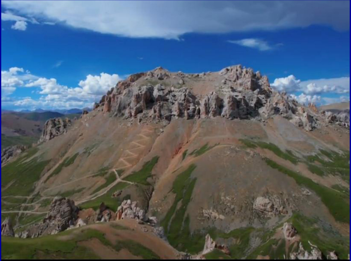
ནགས་སྟོད་གནས་ཆེན་མོ་མོ་ཐག་དཀར།