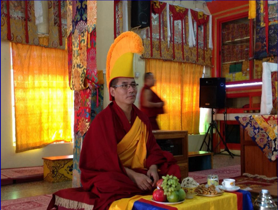
རིགས་ལ་ལ་ཞེན་ལྷག་བསམ་གྱིས་ལྷག་པ་སྲུང་སི་གནས་བརྟུགས་དགེ་བཤེས་ལྷ་རམས་པ་ལྗོ་བཟང་ལྷན་ཚོགས་མཚོག་ནས་ནགས་ལྷའི་སློན་མེ་ འདོན་ཐངས་བཙུ་བདུན་པའི་འགྲོ་གྲོན་ཆ་ཚང་གནང་བར་བཀའ་འདྲིན་སློ་མེད་དུ་ཆེ་ལྷ།