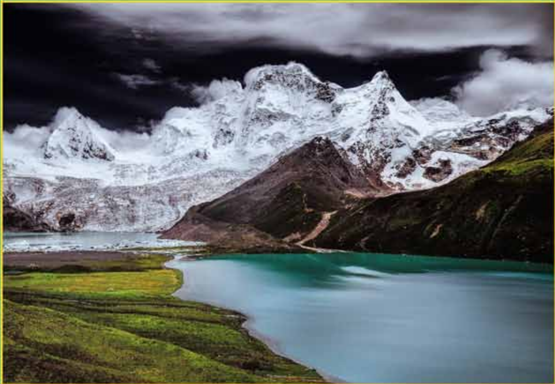
གསལ་ལུའི་མགོན་ལྷ་དཀར་མོ་དང་གསལ་མཚོ་ཁ་རིང་།