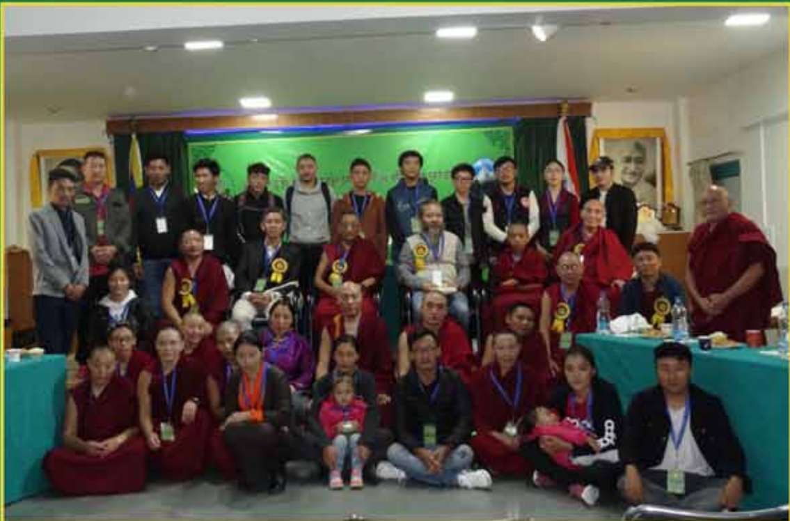
སྐུ་མགོན་ཕྱི་གཙོ་མོ་དཔལ་ལྷན་ཚོས་ཡིག་འགའ་རྫོན་གཡུ་མོག་ཀམ་དགེ་ལེགས་མཚོག་དབུ་བཞུགས་མོག་ བགས་ལྷ་ཚོས་སྤྱིག་ཁང་ལོ་བརྒྱུ་ལོར་བའི་རྗེས་ཐུན་མཛད་སྤྱིའི་སྐབས་ཀྱི་བརྒྱན་བཟང་།